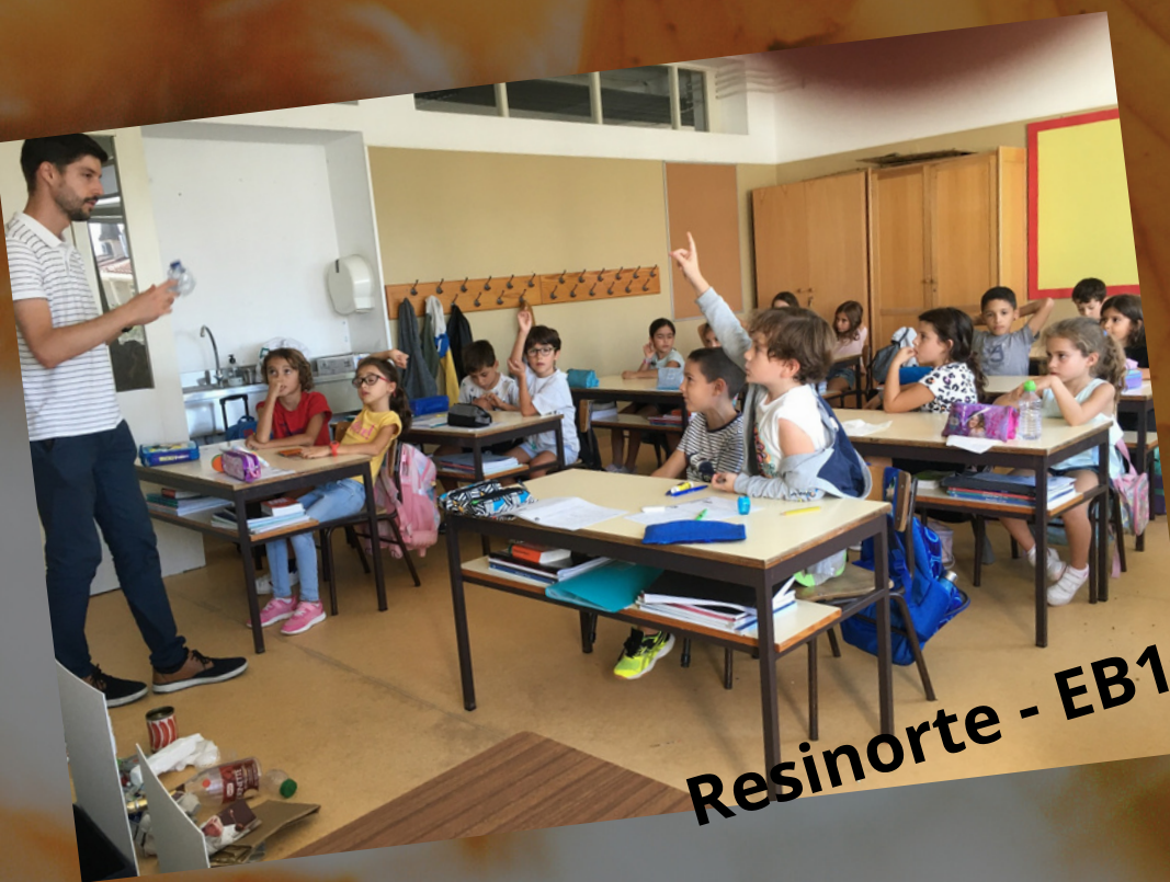
Resinorte - EB1

AE João de Meira acolhe exposição até dia 7 de dezembro